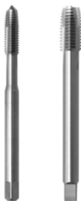
Durchgangs-Bohrungen - DIN 371/376 B

Diese Maschinen-Gewindebohrer in der DIN-Norm 371/376 und in der Ausführung geschliffen HSS-G, sind ein absolutes Spitzenprodukt mit einer extrem hohen Standzeit für den industriellen und handwerklichen Dauereinsatz.